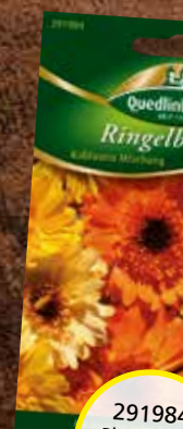
291984 Ringelblumen Kablouna Mischung