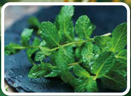
Minz up your life