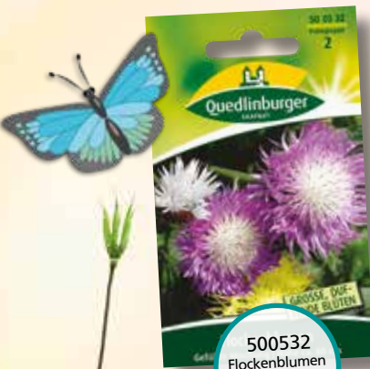
500532 Flockenblumen Gefüllte Mischung