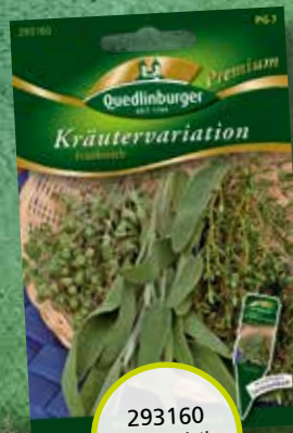
293160 Kräutervariation Frankreich