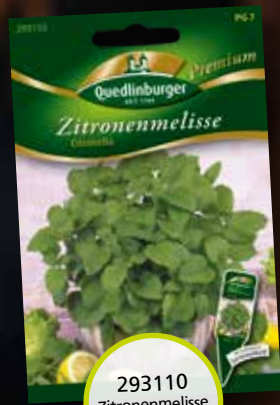
293110 Zitronenmelisse Citronella