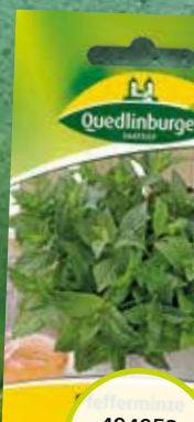
494952 Pfefferminze mehrjährig