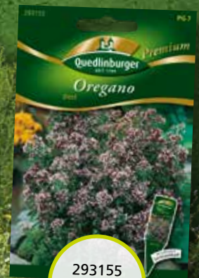
293155 Oregano Dost