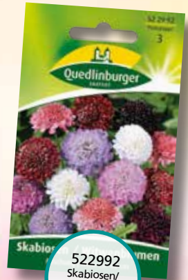
522992 Skabiosen/ Witwenblumen Mischung

Das Ampfer-Grünwiddlerchen wurde von der BUND NRW Naturschutzstiftung und der Arbeitsgemeinschaft Rheinisch-Westfälischer Lepidopterologen e. V. zum Schmetterling des Jahres 2023 gekürt.