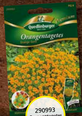
290993 Orangentagetes Orange Gem

Gewächse aus einer Pflanzfamilie (Siehe Kasten) sollten nicht in direkter Nachbarschaft angebaut werden, da sie die gleichen Nährstoffe benötigen, untereinander Krankheiten übertragen können sowie die gleichen Schädlinge anlocken.