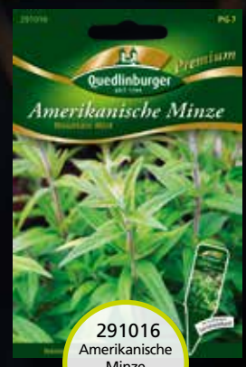
291016 Amerikanische Minze Mountain Mint