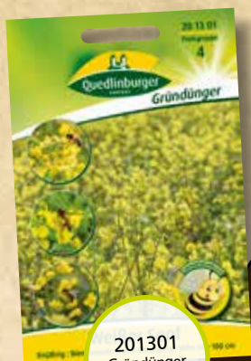
201301 Gründünger Weißer Senf