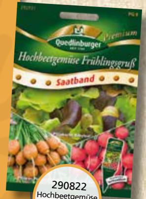
290822 Hochbeetgemüse Frühlingsgruß Saatband