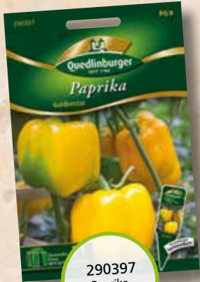
290397 Paprika Goldstar