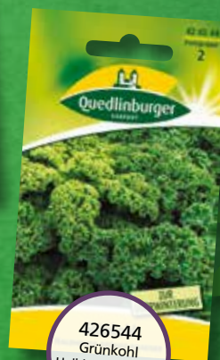
426544 Grünkohl Halbhoher grüner Krauser