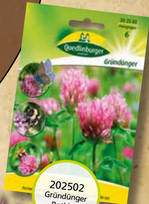
202502 Gründünger Rotklee