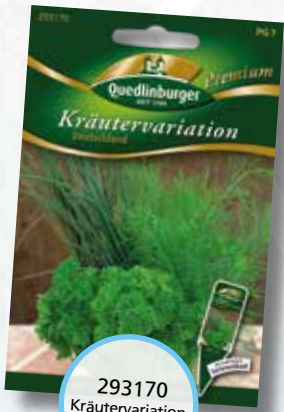
293170 Kräutervariation Deutschland