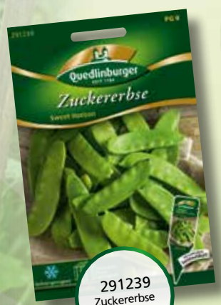
291239 Zuckererbse Sweet Horizon

Die Reihen an Erbsen werden in den Gärten weniger, das sehen wir an unseren Verkaufszahlen. Die Tiefkühlererbse scheint die Macht in den Haushalten zu übernehmen.