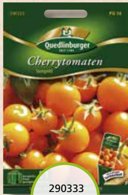
290333 Cherrytomaten Sungold

Gurken. Im Anbau wirklich einfach Anbau, ist ein hoher Ertrag an saftig Früchten zu erwarten.