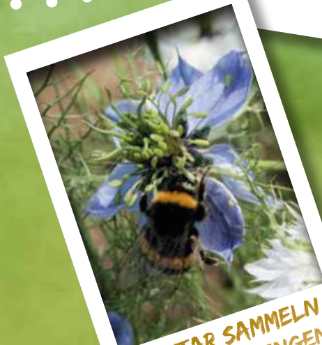
NEKTAR SAMMELN IST SO ANSTRENGEND