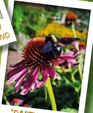
"DARTH VADER" UNTER DEN BIENEN