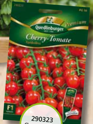
290323 Cherrytomaten Tomolino