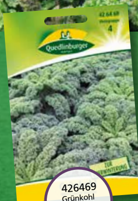
426469 Grünkohl Westlandse Winter