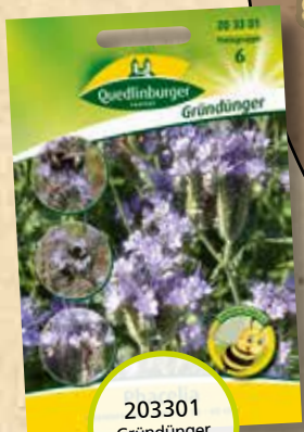
203301 Gründünger Phacelia