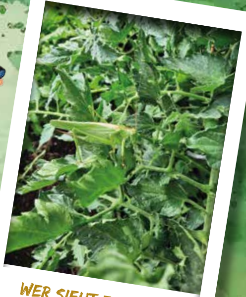
WER SIEHT ES AUCH?