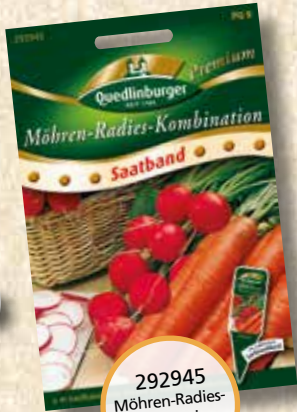
292945 Möhren-Radies- Kombination Saatband