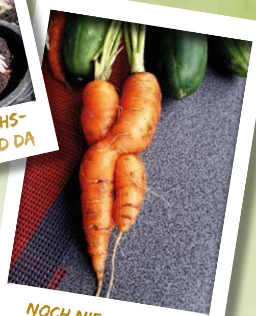
NOCH NIE GESEHEN: KUSCHELNDE MÖHREN