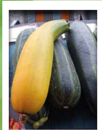
WER WEICHT DA VON DER NORM AB?