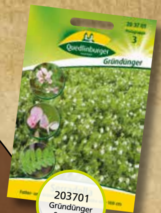
203701 Gründünger Seradella