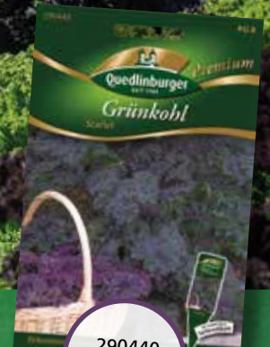
290440 Grünkohl Scarlet