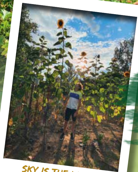
SKY IS THE LIMIT: SONNENBLUMEN GELBE RIESEN