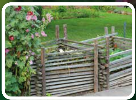
Was ist Permakultur?

*Dieses Titelbild entstand auf der Landesgartenschau Sachsen-Anhalt 2024 in Bad Dürrenberg.