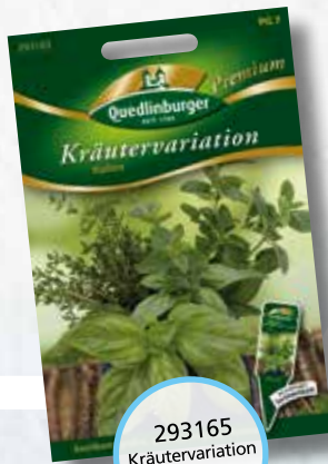
293165 Kräutervariation Italien