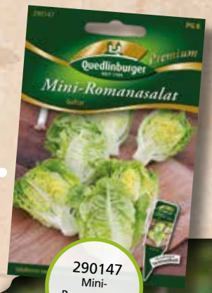
290147 Mini-Romanasalat Gohar