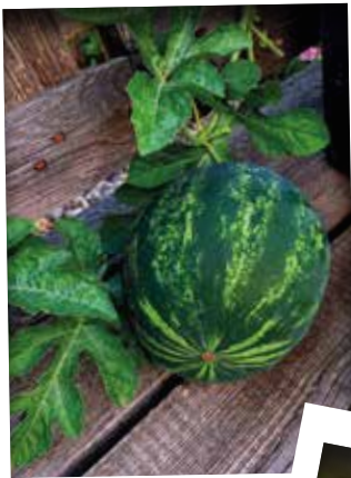
MINI-MELONEN AUCH BEI UNS