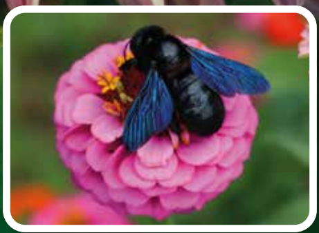
Wildbiene des Jahres