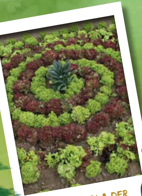
EIN MANDALA DER ANDEREN ART