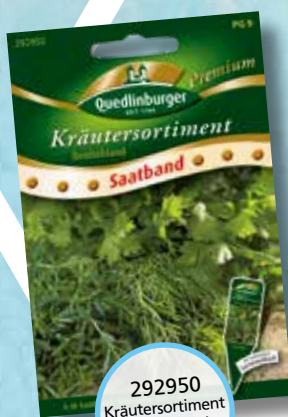
292950 Kräutersortiment Deutschland Saatband