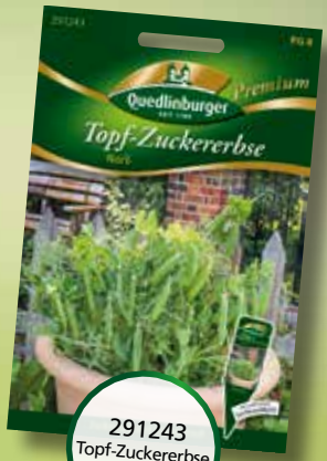
291243 Topf-Zuckererbse Norli