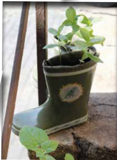
CLEVERES UPCYCLING: ALLES KANN - NICHTS MUSS