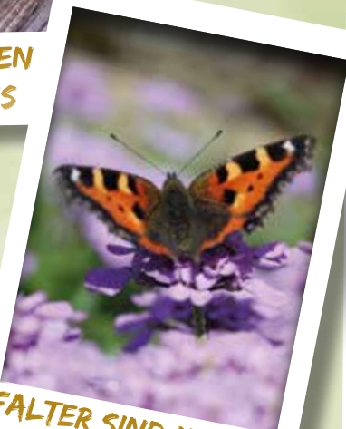
FALTER SIND MAJESTÄTEN DER LÜFTE