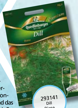
293141 Dill Diana

besonderen Pfiff. Ob als Zugabe zu Cocktails, als Tee oder Smoothie sowie Infused Water sind moderne Trends geworden. Frisch vom Garten in die Küche, lassen sich sommerliche Getränke einfach gestalten. Genießen Sie jetzt das einmalige Aroma und erleben Sie die riesige Vielfalt der verschiedenen Geschmacksrichtungen. Ein reicher Vorrat an konservierten Kräutern macht Freude und lässt Sie die Kraft und das besondere Aroma des Sommers noch viele Monate später genießen.