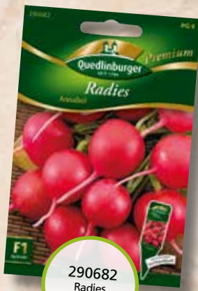
290682 Radies Annabel