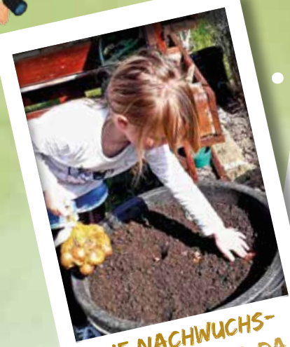
DIE NACHWUCHS- GÄRTNER SIND DA