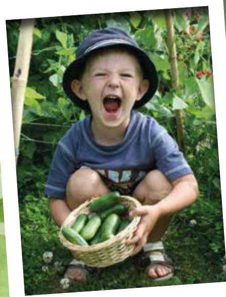
GRÜNE GURKEN VERTREIBEN KUMMER UND SORGEN