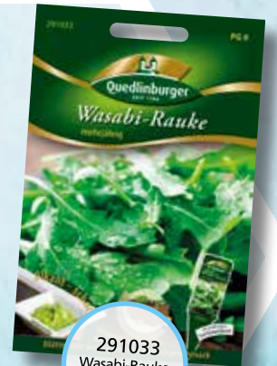
291033 Wasabi-Rauke mehrfährig