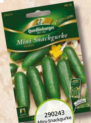
290243 Mini-Snackgurke Picolino